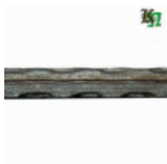
Квадрат, арт. 12Д2 3000мм, кв.12x12мм Вес: 3.43 кг Цена (за штуку): 480 руб.