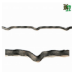
Квадрат для решетки, обжатый, арт. 179 1900мм, кв.10х10мм Вес: 1.5 кг Цена (за штуку): 350 руб.