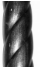
Витая труба, арт. Труба витая 20 3000мм, д=20х1,5мм Вес: 1.54 кг Цена (за штуку): 375 руб.