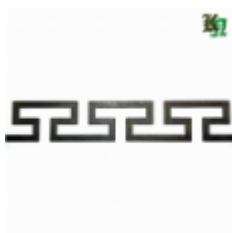
Декоративный прокат, полоса, арт. 824 1200х95х2,5мм Вес: 1.2 кг Цена (за штуку): 490 руб.