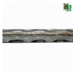
Квадрат, арт. 14Д2 3000мм, кв.14х14мм Вес: 4.4 кг Цена (за штуку): 660 руб.