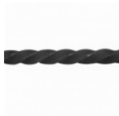
Квадрат, арт. 14Д4 3000мм, кв.14х14мм Вес: 4.4 кг Цена (за штуку): 600 руб.